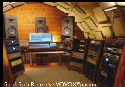
Stockfisch Records · VOVOX®purum

VOVOX AG Neuhaltenring 1 CH-6030 Ebikon / Schweiz Tel. +41 41 420 89 89 E-Mail: info@vovox.com www.vovox.com www.myspace.com/soundconductors